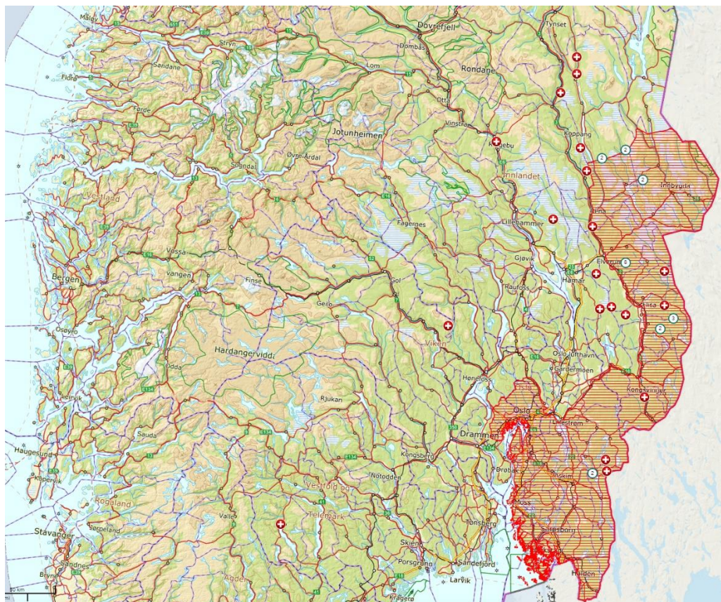
Figur 2. Avgang av ulv i Sør-Norge siden 1. des. 2021. Skravert område viser norsk forvaltningszone for ulv.

Under sist års lisensfelling ble det felt i alt 21 ulver, hvorav én i rovviltregion 2 (Flå). I tillegg er det registrert en avgang på 14 dyr i fellingsperioden (skadefelling og påkjørsel). Etter avsluttet lisensfellingsperiode (31. mai) er fem dyr felt på skadefellingstillatelse, hvorav fire i region 5 Hedmark og én i region 2 (voksen hann i Fyresdal, 1. juni) (Rovbase, 2. august).