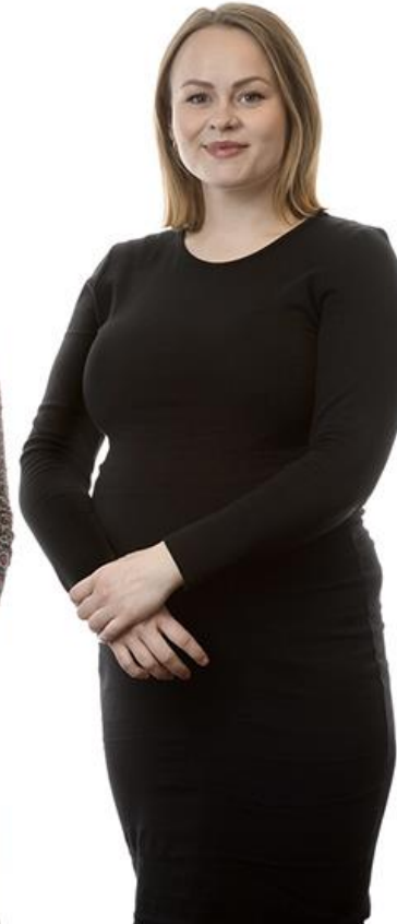
Statssekretær Ragnhild Sjoner Syrstad (Ap)