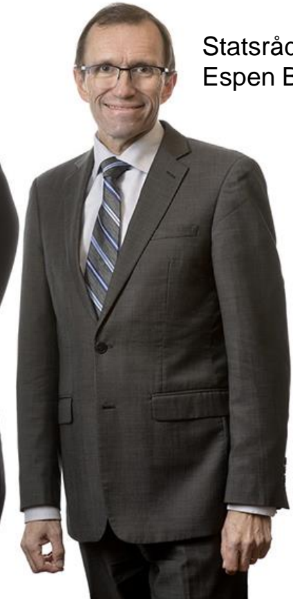
Statsråd Espen Barth Eide (Ap)